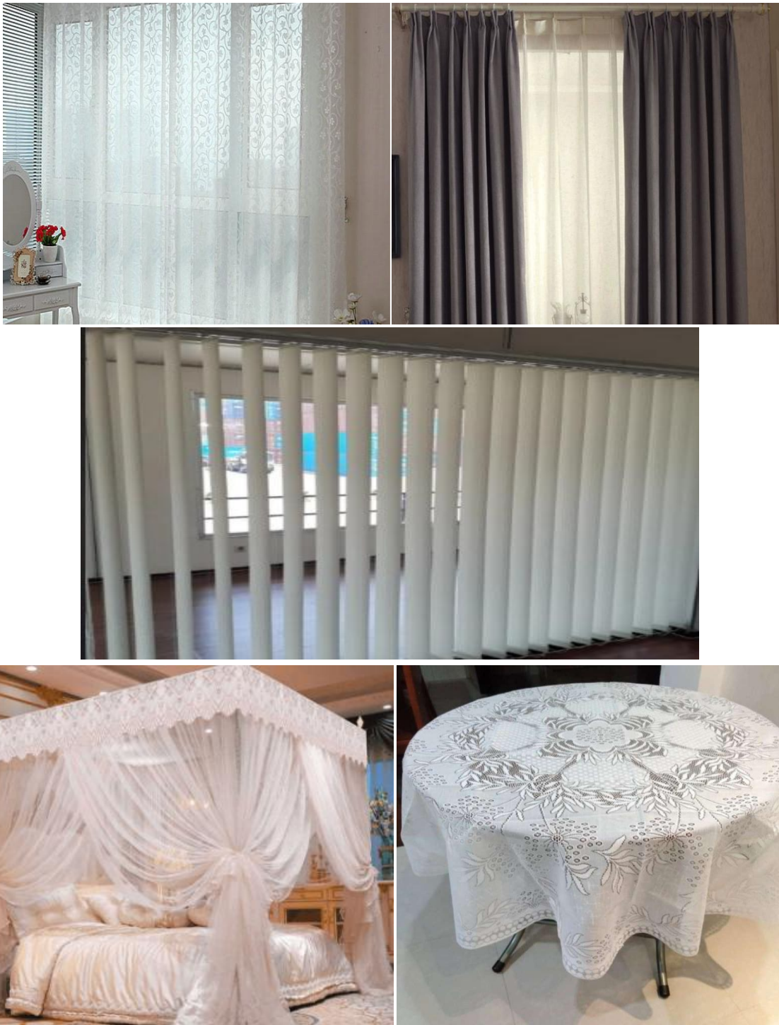
Gambar 1. Tirai (Termasuk Gordien), Kerai Dalam, Kelambu Tempat Tidur, dan Barang Perabot Lainnya

sedangkan tirai dilapisi dengan kain rajutan/kaitan yang ringan dan mengurangi intensitas cahaya luar yang masuk.