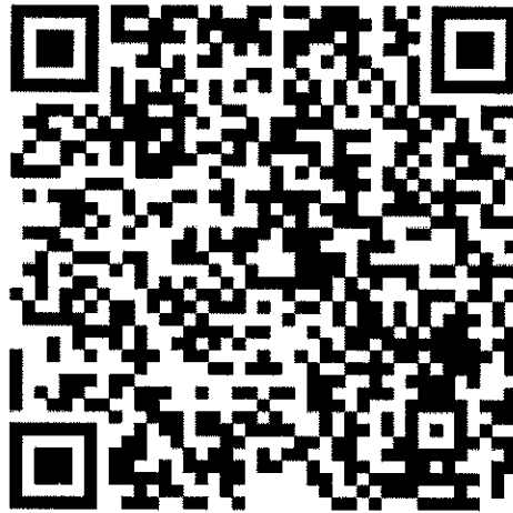
網路報名 QR code

請參加人員透過 Google 表單進行報名，以利報名作業資料彙整，謝謝 若報名流程有任何問題請透過電話或 email 聯繫 (03)573-0675 分機 24 曹書涵 小姐 E-mail： shuhan@edf.org.tw