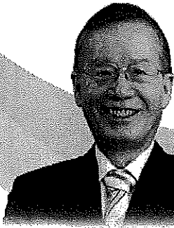
台灣永續能源研究基金會 董事長 簡又新大使